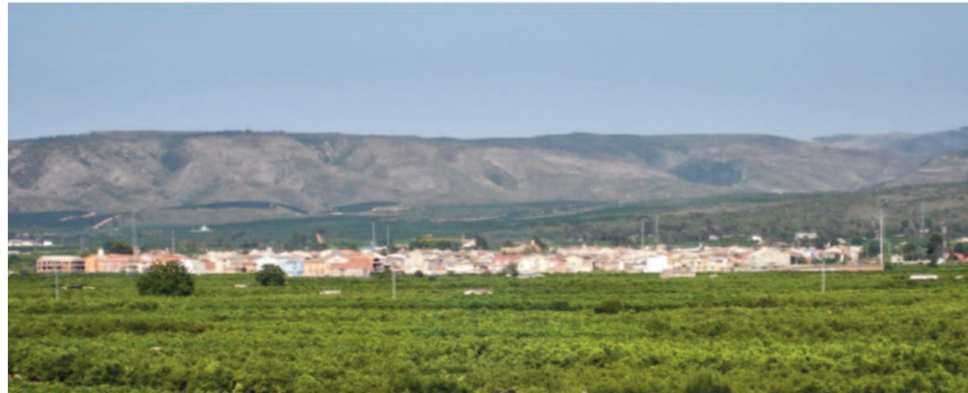
Rafelguaraf: vista des de ponent

Vicent Sanxis Martínez (Cronista oficial de Rafelguaraf)