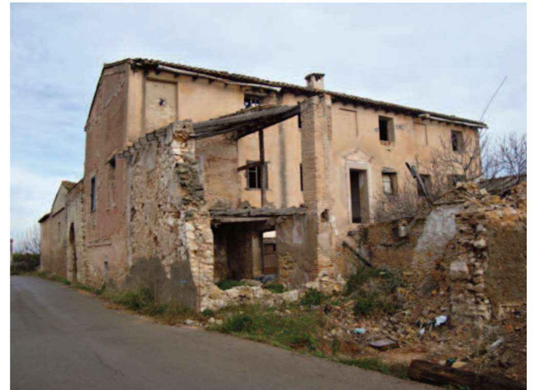
Berfull: casa de la Senyoria