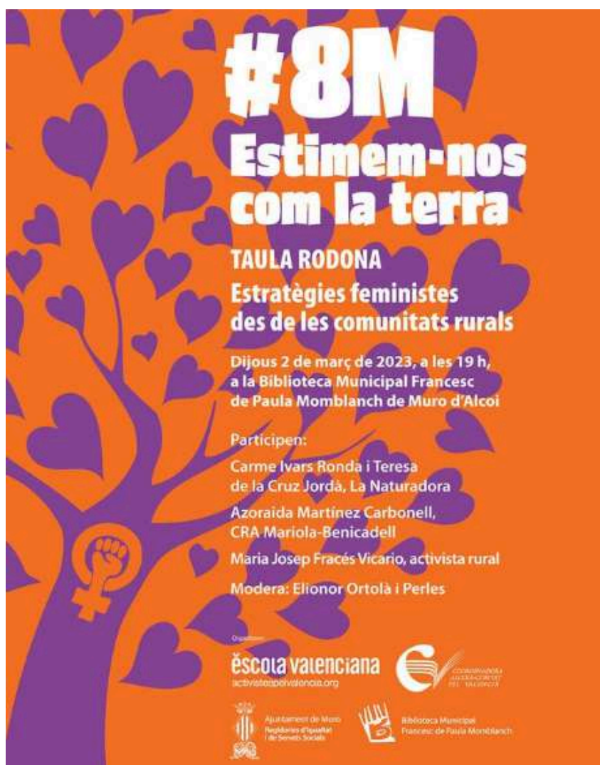
Cartell taular redona 8M “Estratègies feministes des de les comunitats rurals”