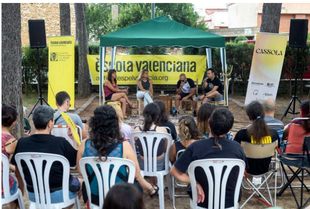
Taula rodona "Guillem Agulló: Memòria i resistència"

El Cicle Cassola es va desenvolupar a la comarca de la Plana Alta en el marc de les activitats culturals que complementen la celebració de la trobada juvenil més important del País Valencià entorn la música i la llengua.