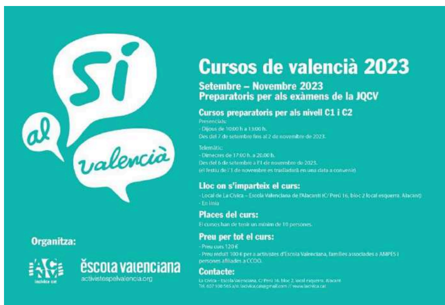
Cartell Cursos de Valencià

Durant l'any 2023, Escola Valenciana ha organitzat i realitzat cursos de tots els nivells, en diverses localitats valencianes.