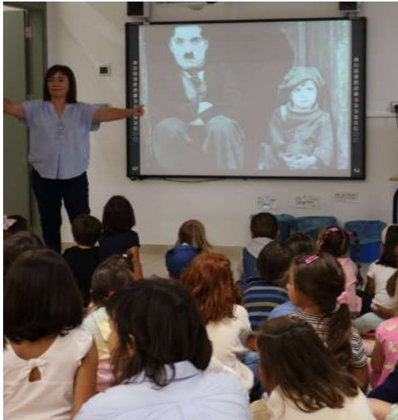
Taller de cinema als CRA en Castellnovo