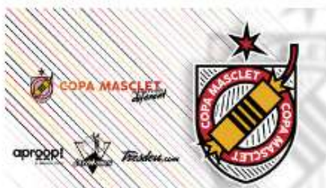
Copa Masclet (2023)

L'última fase, de recaptació de finançament, s'ha desenvolupat entre el 11 de setembre i el 22 d'octubre, en la qual s'ha posat en marxa tot el treball fet prèviament de difusió i comunicació dels projectes, el qual ha permés que ambdós projectes superaren l'últim procés i hagen assolit el doble del finançament marcat com a objectiu.