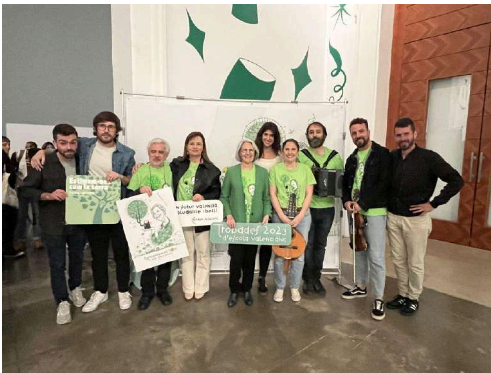
Acte de presentació Trobades 2023