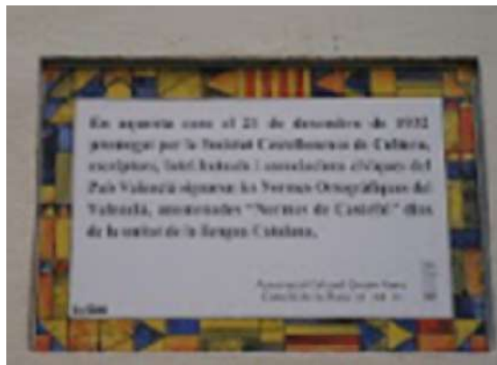
Placa commemorativa de les Normes

Amb el nom de «Normes de Castelló» o «Normes del 32» es coneix l'acord que signaven, a Castelló de la Plana l'any 1932, representants del món de la cultura i del valencianisme i institucions culturals de tot el País Valencià, a proposta de la Societat Castellonenca de Cultura. Un acord que certificava l'adopció amb lleus matisos de la reforma ortogràfica empresa al Principat per l'Institut d'Estudis Catalans, amb Pompeu Fabra al capdavant, i que s'havia materialitzat en les Normes ortogràfiques de 1913, i la Gramàtica catalana , del 1918.