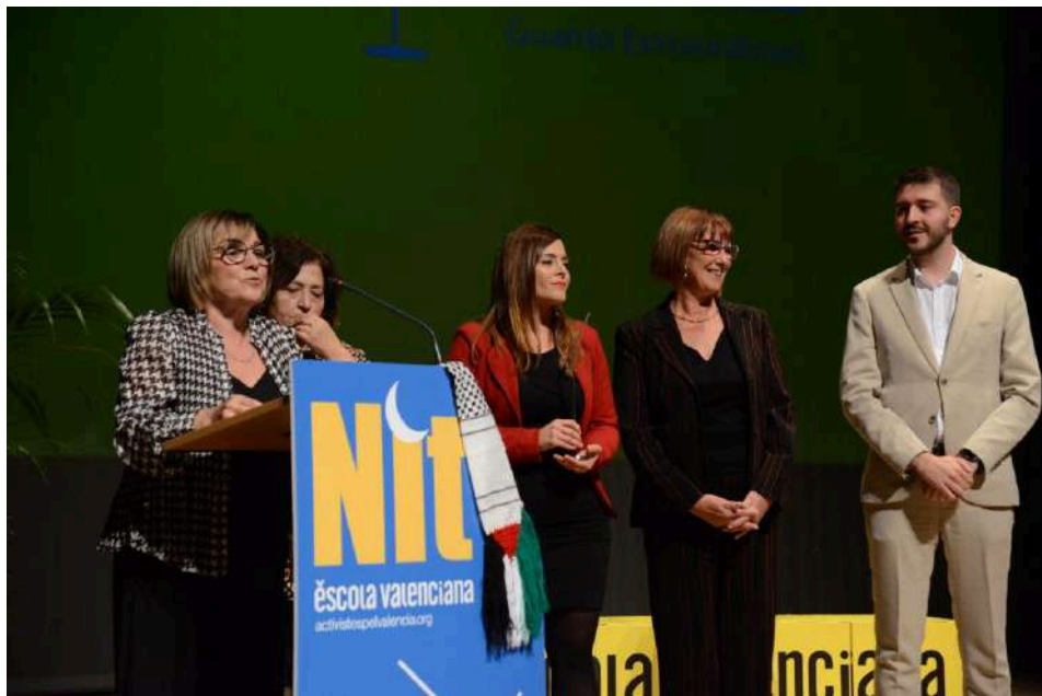
CEIP Bosco de Cocentaina - XX Nit d'Escola Valenciana

A continuació, es va lliurar el guardó Extraordinari al CEIP Bosco de Cocentaina, un exemple de com l'escola és el futur de la llengua i la identitat de la població, així com de les reivindicacions socials. Les últimes 4 directores del centre, van ser les encarregades de recollir el premi.