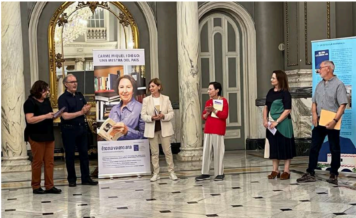
Inauguració de l'exposició al Saló de Cristall de l'Ajuntament de València

Aquesta exposició va comptar amb el suport i la col·laboració activa de l'Acadèmia Valenciana de la Llengua.