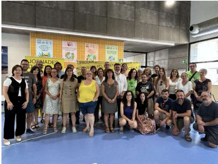
Jornades d'Estiu 2023