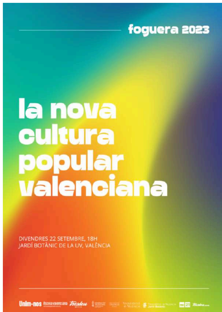
Cartell del Cicle Foguera 2023 a València

El format de l'esdeveniment ha estat dinàmic i participatiu, un fòrum on les persones ponents com les assistents han pogut interactuar per finalment extreure'n unes conclusions i aprenentatges per seguir construint la cultura popular valenciana i conformant la identitat del poble valencià del futur.