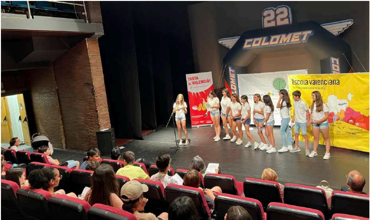
Acte de cloenda Voluntariat als IES curs 2022-2023