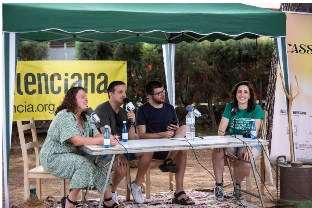
Podcast en directe amb Greuges Pendants