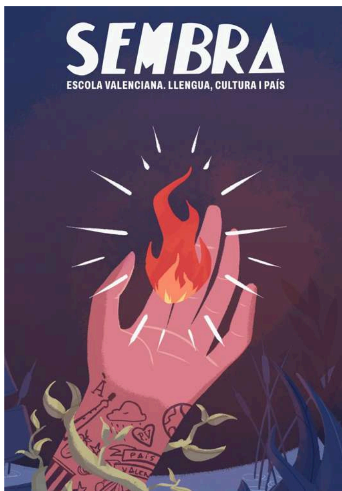
Revista sembra 2023

Des de 2017, s'han publicat diversos números amb una regularitat anual. En aquest enllaç podeu consultar les edicions realitzades fins ara: https://escolavalenciana.org/web/sembra/