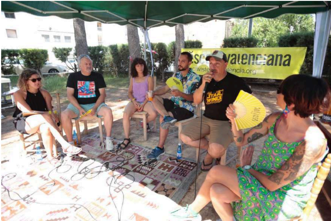
La revolució al plat. Sobirania alimentària i territoris