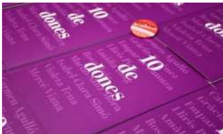
Llibre 10 de dones

En campanyes anteriors, Escola Valenciana edità el llibre 10 de 2 , un conjunt de 10 relats inspirats en històries entre parelles lingüístiques d'edicions anteriors del Voluntariat pel Valencià. Com a nexa comú, les 10 històries implicaven a 2 persones (motiu del nom del llibre), per regla general una aprenenta i una de voluntària. Finalment, aquestes 10 històries estaven escrites per participants del programa, que havien narrat la seua experiència o inventat una història en clau de parella lingüística. 10 de 2 fou editat un total de 5 vegades, cosa que significava un total aproximat de 8.000 llibres impresos.