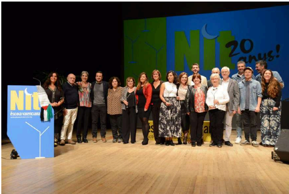
XX Nit d'Escola Valenciana a Cocentaina

Escola Valenciana va celebrar la XX Nit d'Escola Valenciana dissabte 18 de novembre al Centre Cultural El Teular, al Comtat, amb la participació d'activistes, col·lectius i institucions d'arreu el país. L'acte, va acollir el lliurament dels guardons "Intentant la llibertat", a la promoció i ús social del valencià, i la presentació de les Trobades 2024.