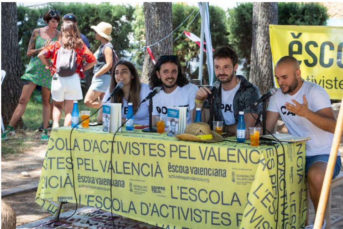
Podcast amb dolçet pal café