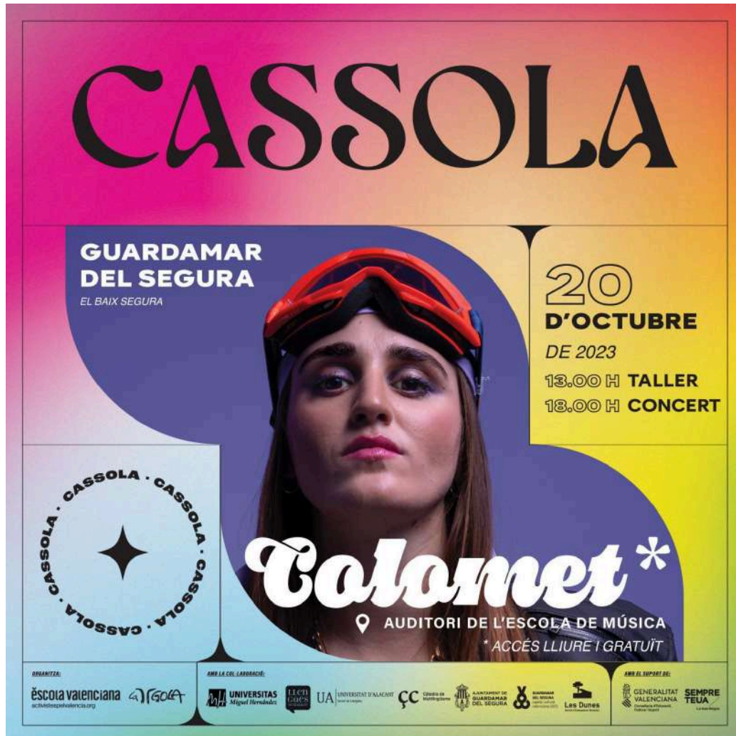
Cartell del Cicle Cassola a Guargamar