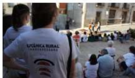
Festival d'Alger (2023)